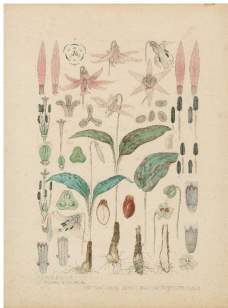
左：ウンモンカンアオイ 右：カタクリ ともに佐久間文吾筆 伊藤篤太郎筆