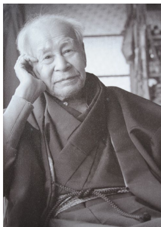
牧野富太郎、東大泉の自宅にて

1926(大正15)年に渋谷から北豊島郡大泉村(現練馬区立牧野記念庭園の所在地)に移り住み、1957(昭和32)年に満94歳で没するまでの約30年をこの地で過ごしました。