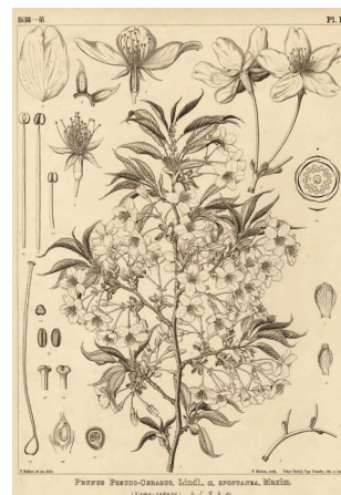
牧野富太郎が原図を描いた『大日本植物志』に載るヤマザクラの図